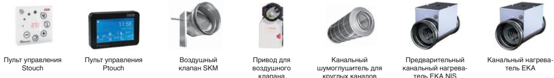
Пульт управления Stouch